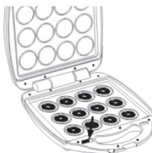
To remove, pull the tab outward to release the cooking plate, raise the heating plate upwards to remove it.