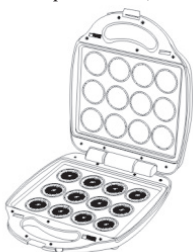
Open the sandwich maker

This sandwich maker incorporates detachable cooking plates. Choose your desired cooking plate for the task to be performed. Install the cooking plates as shown in the following illustration.